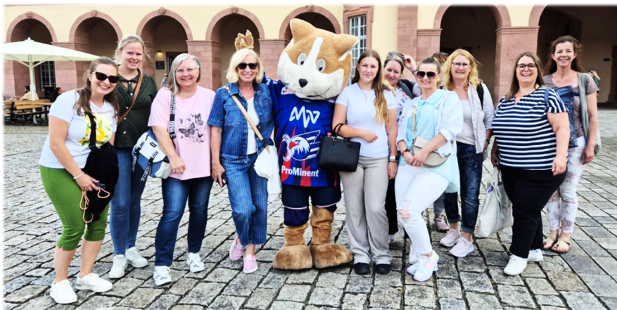
Das Team der Kita Regino

Wir wünschen uns ein vertrauensvolles Miteinander und Zeit für Begegnungen in unserer Kindertagesstätte.